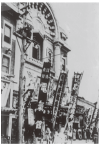
大正9年(1920)「電気館」 静活(株)の第2号館