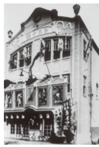
大正8年(1919)「キネマ館」 静活(株)の第1号館 映画専門館